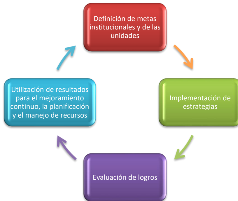
Figura 2: Proceso de Avalúo de la Efectividad Institucional

El modelo para el avalúo institucional de AUPR se enmarca en la evaluación y el seguimiento del progreso hacia el logro de la misión a través del avalúo de los objetivos y las metas estratégicas del plan estratégico a cinco años y los planes de trabajo anuales. Además de evaluar el logro de los objetivos y las metas, es necesario evaluar el impacto que AUPR está teniendo en la población estudiantil.