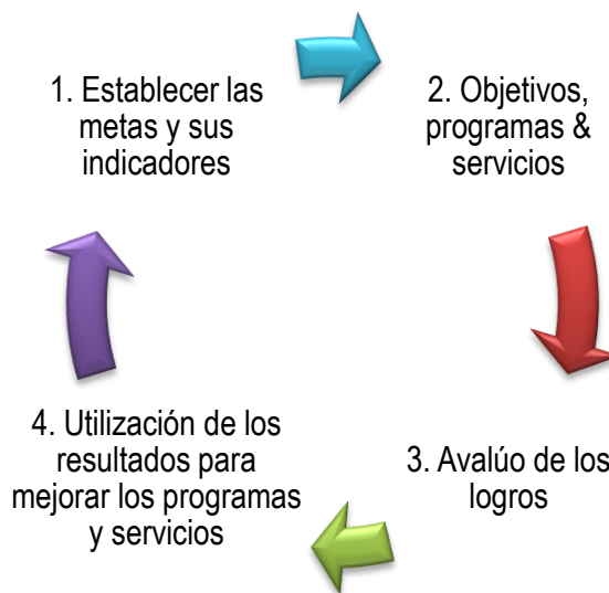
Figura 1: Ciclo de Planificación-Avalúo (MSCHE)

A través de la Política de Avalúo Institucional AUPR establece que los procesos de avalúo deben ser organizados, coordinados, continuos y sostenidos. Además, las actividades de avalúo deben ser planificadas, especificando lo qué se hará, cuándo, cómo, para qué, etc., utilizando medidas directas e indirectas, datos cuantitativos y cualitativos y metodologías diversas. Los procesos y actividades de avalúo deben estar dirigidos a informar y evidenciar el progreso hacia el logro de las metas y el nivel de cumplimiento con los objetivos y los estándares de acreditación de la MSCHE. Finalmente, y basándose en los resultados obtenidos, los procesos de avalúo institucional deben generar la formulación de acciones concretas que mejoren la efectividad institucional.