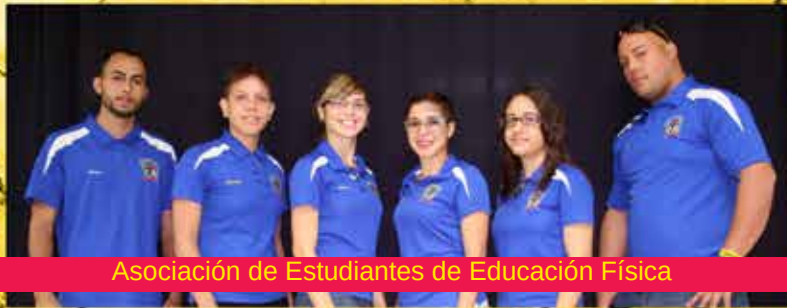
Asociación de Estudiantes de Educación Física