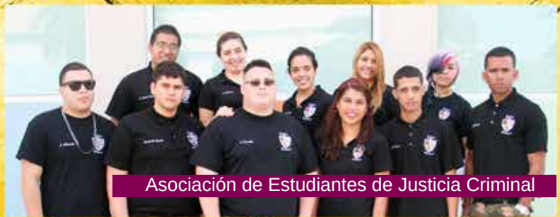
Asociación de Estudiantes de Justicia Criminal