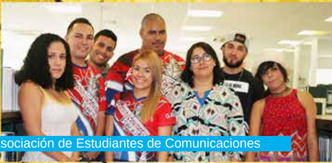
Asociación de Estudiantes de Comunicaciones