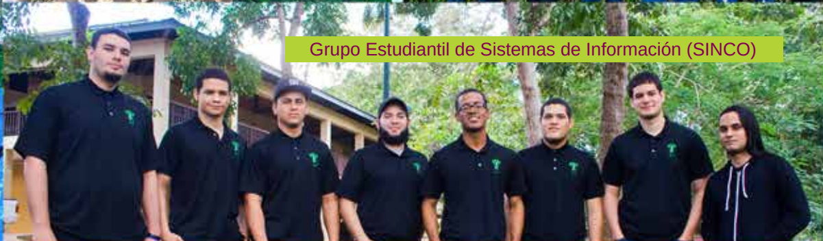
Grupo Estudiantil de Sistemas de Información (SINCO)