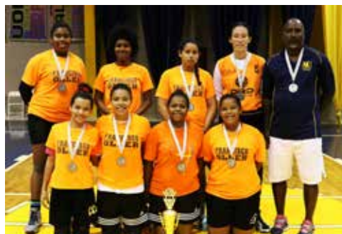
¡FELICIDADES A LAS SUBCAMPEONAS 2016! ESCUELA FRANCISCO OLLER, CATAÑO