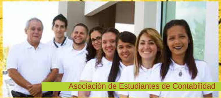
Asociación de Estudiantes de Contabilidad