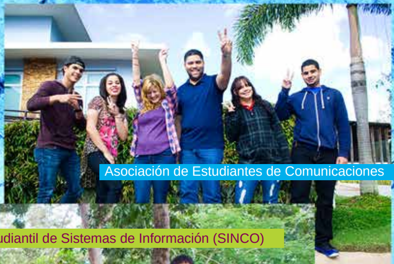
Asociación de Estudiantes de Comunicaciones