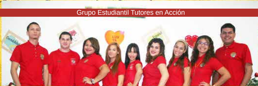
Grupo Estudiantil Tutores en Acción