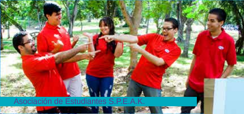
Asociación de Estudiantes S.P.E.A.K.