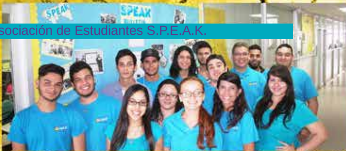
Asociación de Estudiantes S.P.E.A.K.