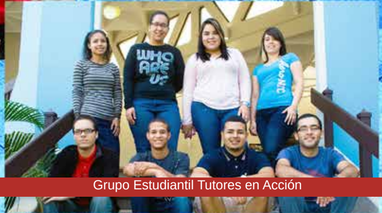
Grupo Estudiantil Tutores en Acción