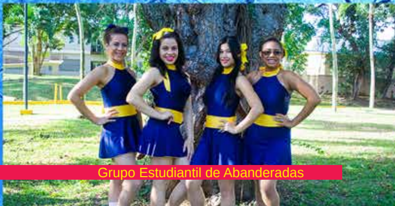
Grupo Estudiantil de Abanderadas