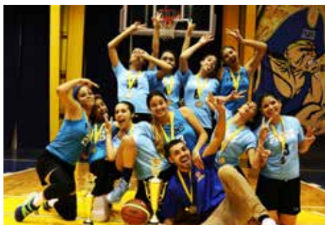
¡FELICIDADES A LAS CAMPEONAS 2016! ESCUELA FRANCISCO OLLER, CATAÑO